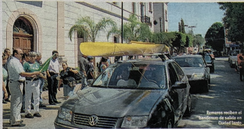
Remeros reciben el banderazo de salida en Ciudad Lerdo

Este viernes se pone en marcha la XLVI Gran Regata Internacional del Río Nazas, con salida desde Rodeo