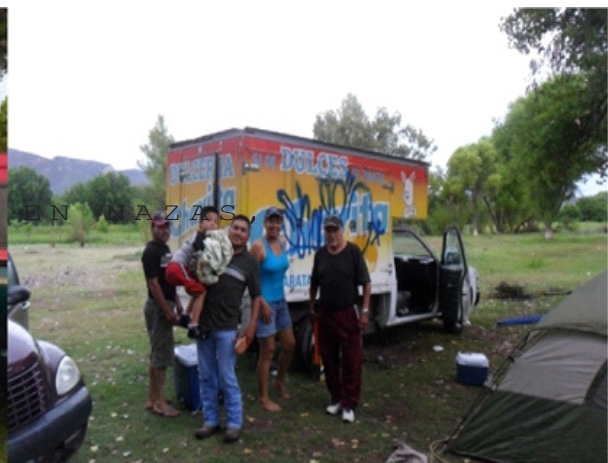
CAMPAMENTO EN NAZAS, DGO.