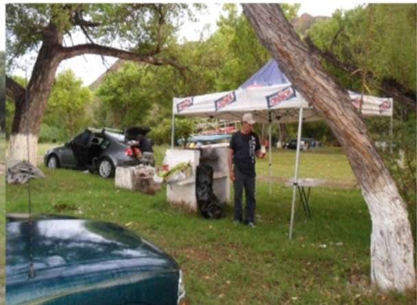
CAMPAMENTO EN NAZAS, DGO.