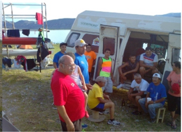
EN EL CAMPAMENTO DE LA PRESA FCO. ZARCO