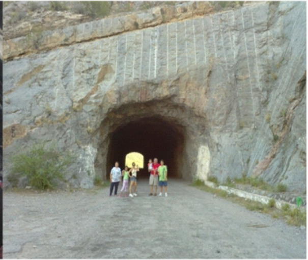
EN EL CAMPAMENTO DE LA PRESA FCO. ZARCO