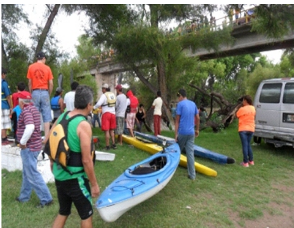
PREPARANDO LA SALIDA EN PASO NACIONAL