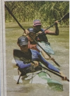
Los jóvenes cerraron con todo