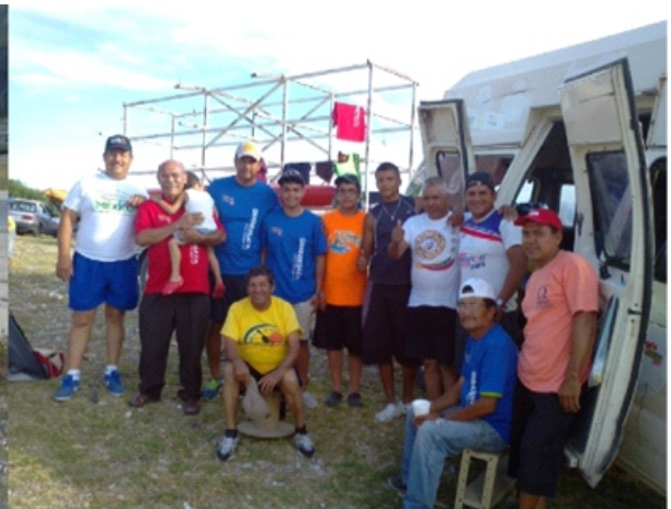
EN EL CAMPAMENTO DE LA PRESA FCO. ZARCO