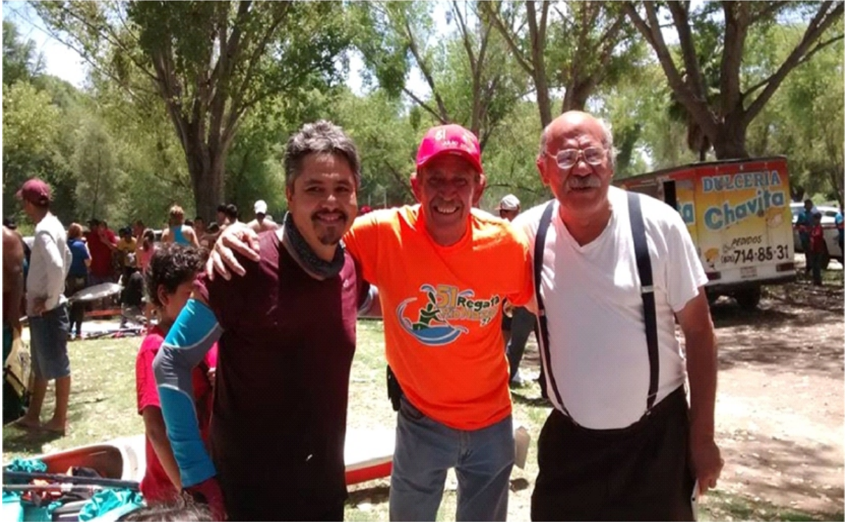
CAMPAMENTO EN NAZAS, DGO.

DEL VIERNES 18 AL DOMINGO 20 DE JULIO DE 2014.