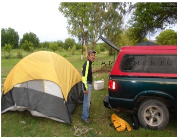
CAMPAMENTO EN NAZAS, DGO.