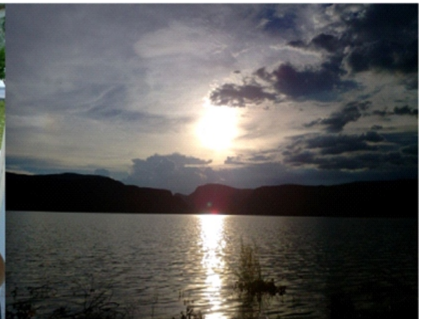
EN EL CAMPAMENTO DE LA PRESA FCO. ZARCO