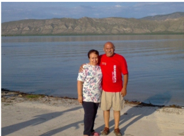
EN EL CAMPAMENTO DE LA PRESA FCO. ZARCO

DEL VIERNES 18 AL DOMINGO 20 DE JULIO DE 2014.