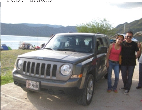
EN EL CAMPAMENTO DE LA PRESA FCO. ZARCO