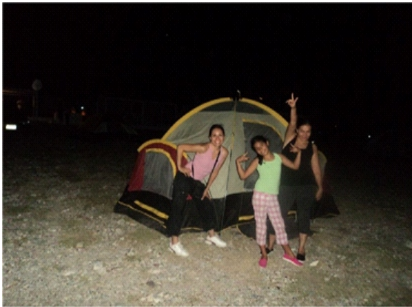
EN EL CAMPAMENTO DE LA PRESA FCO. ZARCO