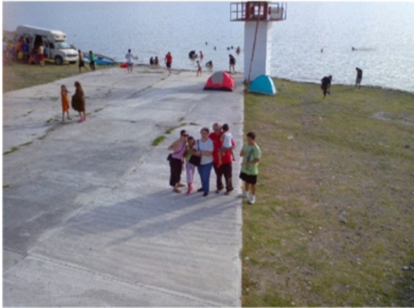
EN EL CAMPAMENTO DE LA PRESA FCO. ZARCO

DEL VIERNES 18 AL DOMINGO 20 DE JULIO DE 2014.