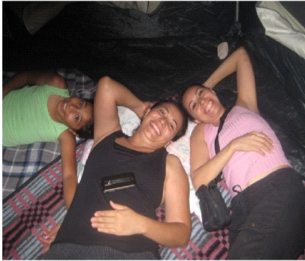
EN EL CAMPAMENTO DE LA PRESA FCO. ZARCO

DEL VIERNES 18 AL DOMINGO 20 DE JULIO DE 2014.