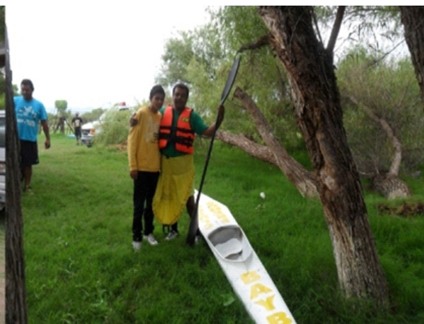
PREPARANDO LA SALIDA EN PASO NACIONAL