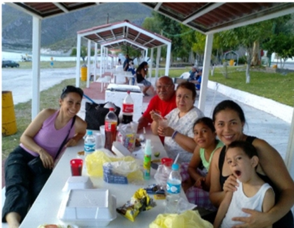
EN EL CAMPAMENTO DE LA PRESA FCO. ZARCO