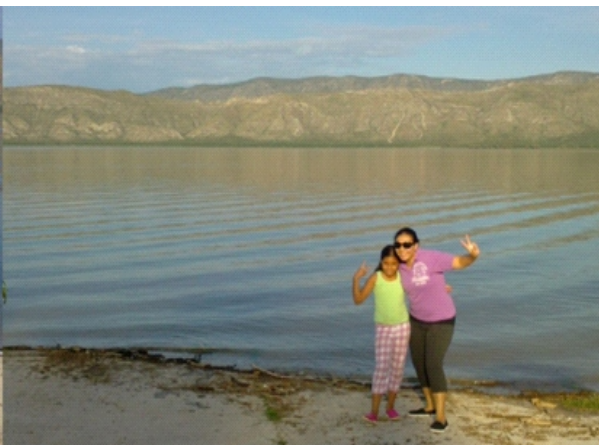
EN EL CAMPAMENTO DE LA PRESA FCO. ZARCO