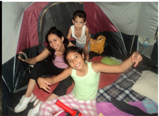
EN EL CAMPAMENTO DE LA PRESA FCO. ZARCO