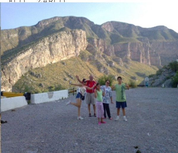
EN EL CAMPAMENTO DE LA PRESA FCO. ZARCO