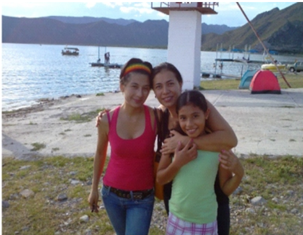
EN EL CAMPAMENTO DE LA PRESA FCO. ZARCO