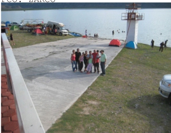
EN EL CAMPAMENTO DE LA PRESA FCO. ZARCO