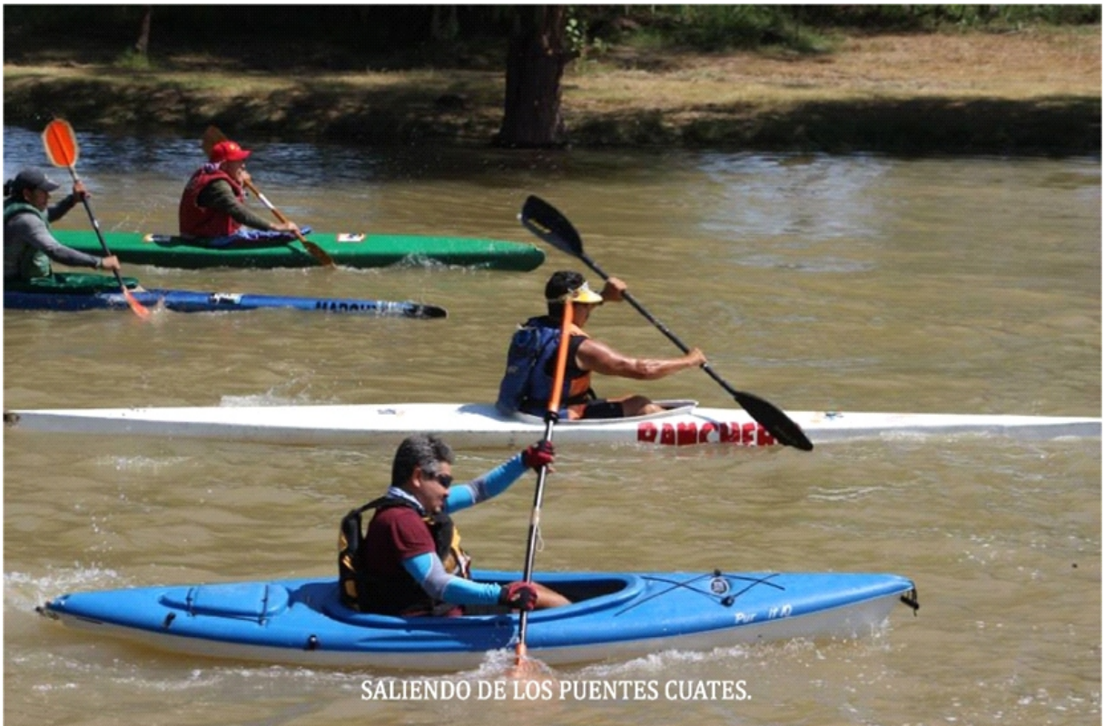
SALIENDO DE LOS PUENTES CUATES.