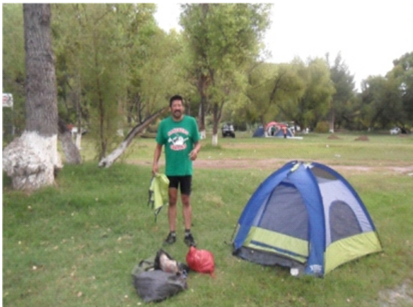
CAMPAMENTO EN NAZAS, DGO.

DEL VIERNES 18 AL DOMINGO 20 DE JULIO DE 2014.