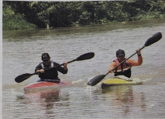
Tremendos cierres se dieron en la recta final