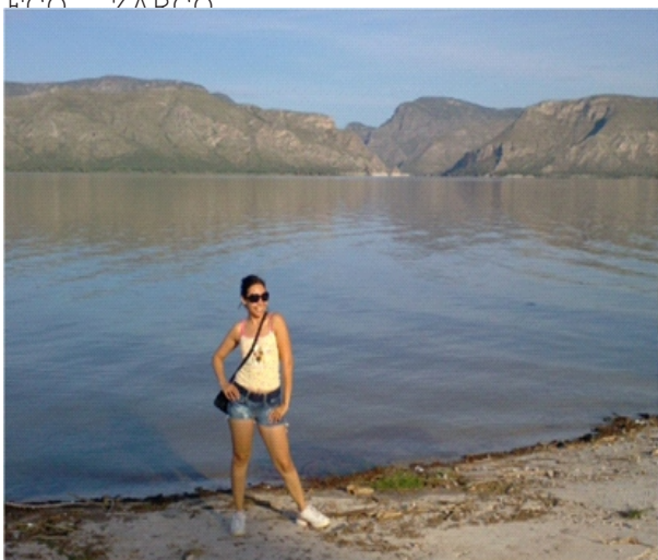
EN EL CAMPAMENTO DE LA PRESA FCO. ZARCO