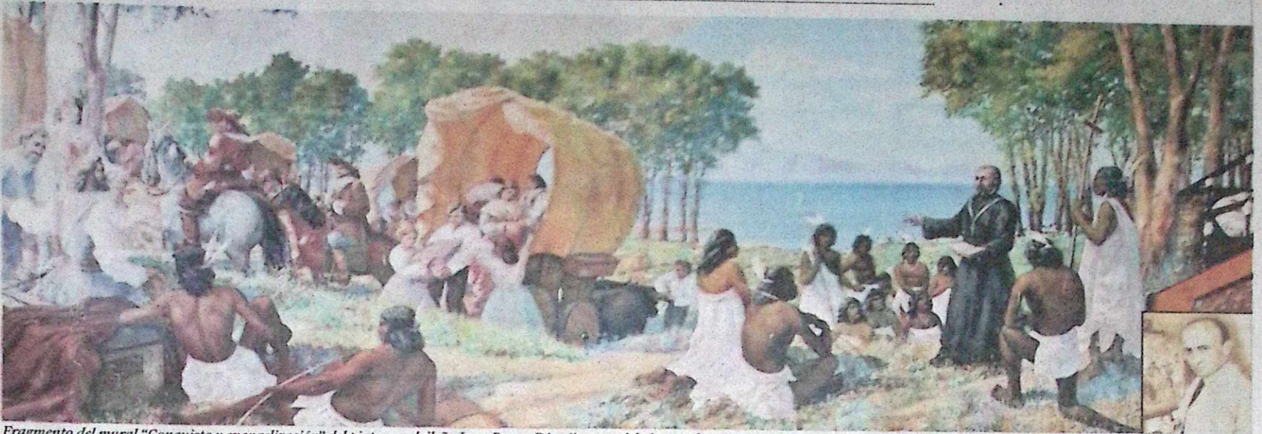
Fragmento del mural "Conquista y evangelización" del pintor madrileño Juan Bueno Díaz (imagen del pintor superpuesta en la esquina inferior derecha.)

Coordinación de la serie: Yeye Romo Zozaya